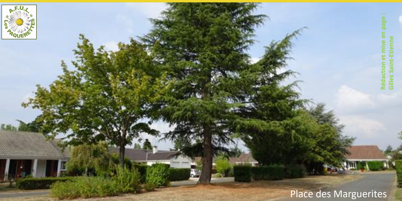
Place des Marguerites

Rédaction et mise en page : Gilles Saint-Etienne