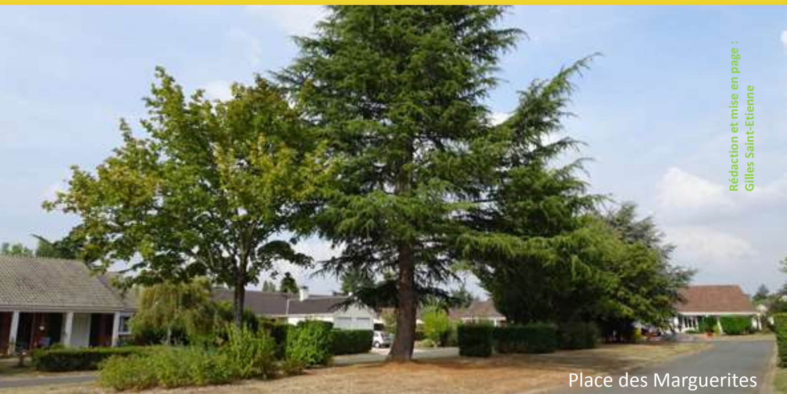
Place des Marguerites

Rédaction et mise en page : Gilles Saint-Etienne