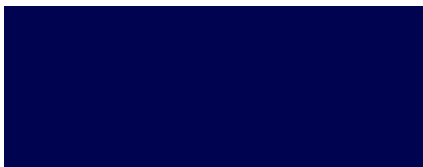
RAL 5022 Bleu nocturne