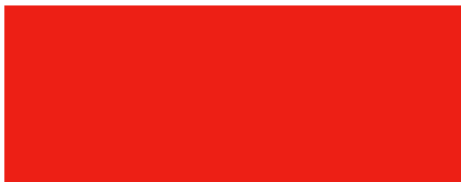
RAL 2002 Orangé sang