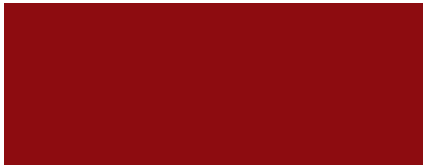
RAL 3011 Rouge brun