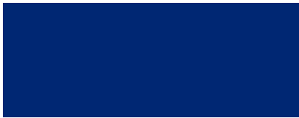
RAL 5010 Bleu gentiane