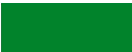
RAL 6017 Vert mai