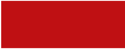
RAL 3001 Rouge de sécurité