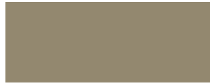
RAL 7034 Gris jaune