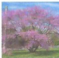
Arbre de Judée